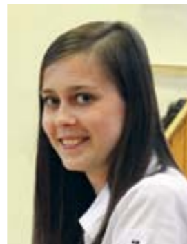
автор: Екатерина Сульдяева , студентка 2-го курса экономического факультета

– Больше всего нравятся люди! Они очень приветливые. Но я считаю, что неплохо было бы специализировать студсовет по сферам деятельности. Это