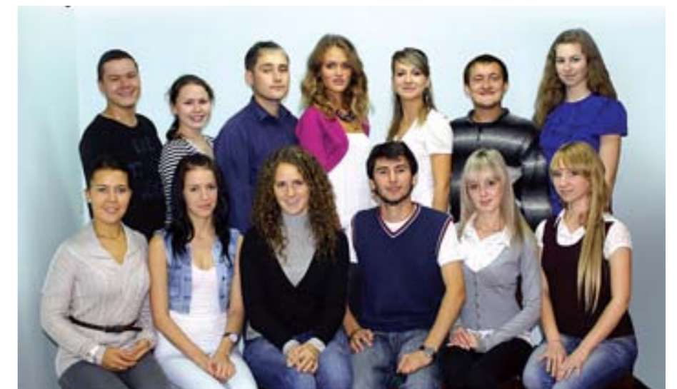
На фото: студенческий совет Ижевской ГСХА.

совета академии нельзя оценивать только по деятельности его руководства. Управление управлением, а всё-таки, основную работу делает коллектив! Как я уже говорила, в коллективе совета собраны разносторонне развитые личности, каждый из которых играет свою маленькую, но значимую роль в команде. Кто-то умеет завлечь публику своим актёрским талантом, кто-то прекрасно танцует, играет на гитаре или сочиняет сценарии, кто-то отвечает за составление документации и ведение делопроизводства, а кто-то ловко может запечатлеть на камере все яркие моменты деятельности студенческого совета! В студенческом совете академии для каждого найдётся своё дело, которое, несомненно, окажется существенным вкладом в будущее студенческой общественной жизни!