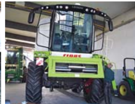
Гараж с учебной техникой в академии ДОЙЛА-Нинбург ГмбХ.

«ДОЙЛА», образовательное учреждение с многолетней историей (основано оно в 1926 году), в настоящее время представляет собой крупный учебный центр, где ежегодно проходят обучение и практику около 70 000 слушателей – учащихся аграрных школ и колледжей, а также работников АПК, желающих в короткие сроки повысить свой профессиональный уровень, познакомиться с новейшими техническими достижениями в области механизации и автоматизации сельхозпроизводства.