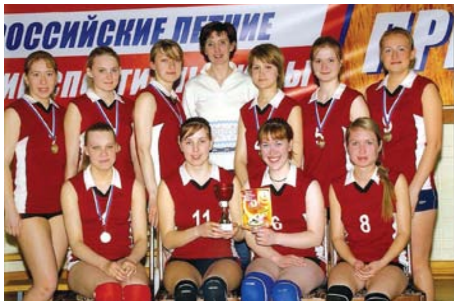
На фото: женская команда по волейболу