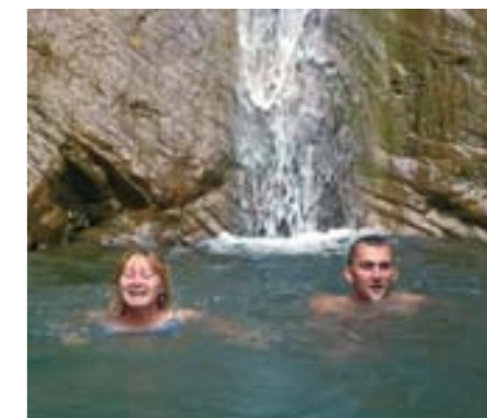
автор: Екатерина Фролова, студентка 4-го курса агрономического факультета