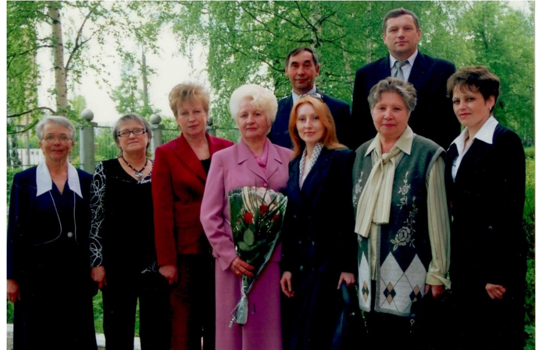
Фото: Руководители и преподаватели Игринской школы выходного дня

В течение учебного года было охвачено более 1000 учащихся общеобразовательных школ.