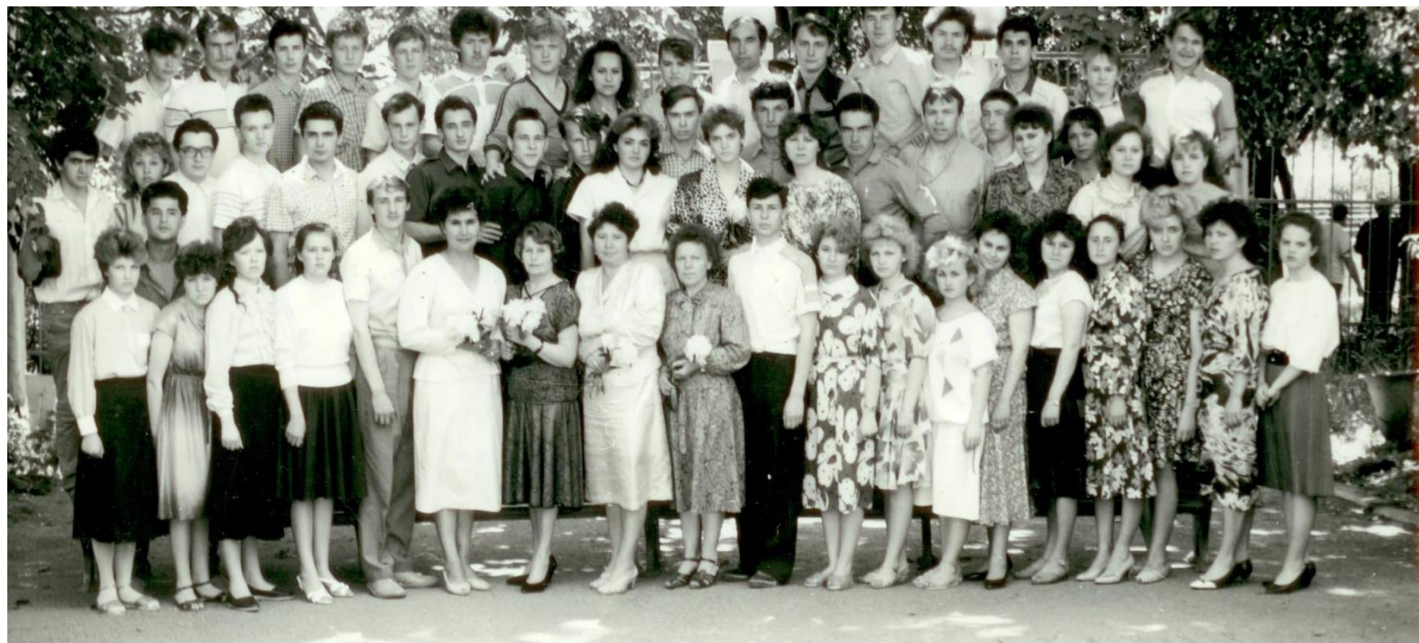
ВЫПУСК СЛУШАТЕЛЕЙ ДНЕВНОГО ПОДГОТОВИТЕЛЬНОГО ОТДЕЛЕНИЯ 1990 ГОД