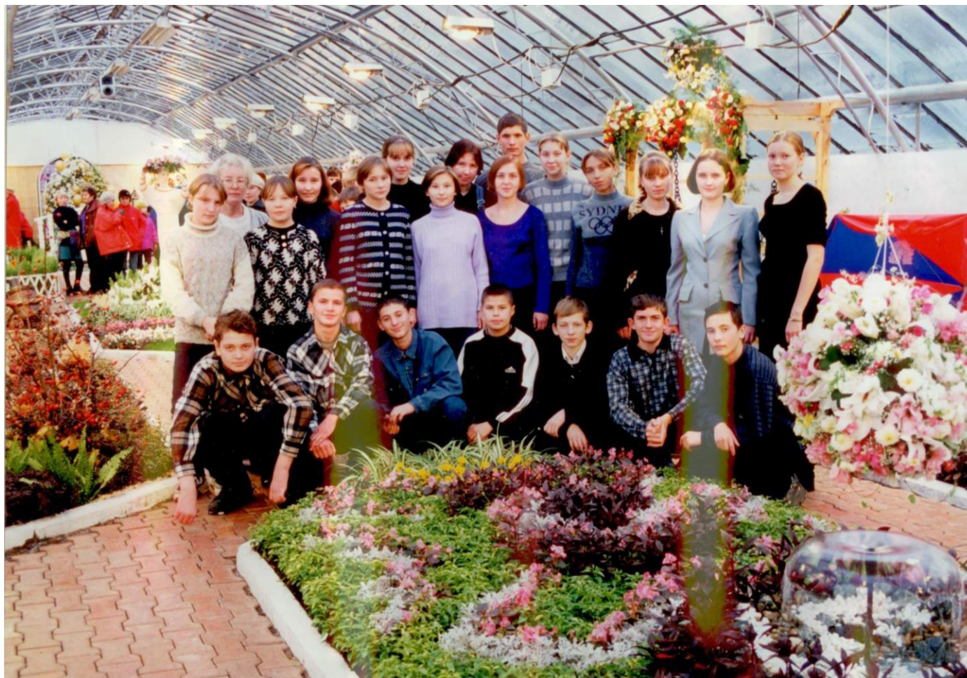
Фото: учащиеся Каракулинской агрошколы Каракулинского района УР.

По окончании обучения слушателям выдавали свидетельства о присвоении рабочей профессии. Для слушателей агрошкол был льготный конкурс для зачисления в число студентов 1 курса ФГБОУ ВО Ижевская ГСХА. Для выявления лучших учащихся агрошкол, проводилась комплексная олимпиада «Здравствуй, XX I- век». По решению жюри, победители олимпиады, занявшие I, II и III места, зачислялись без сдачи вступительных экзаменов на I курс академии.