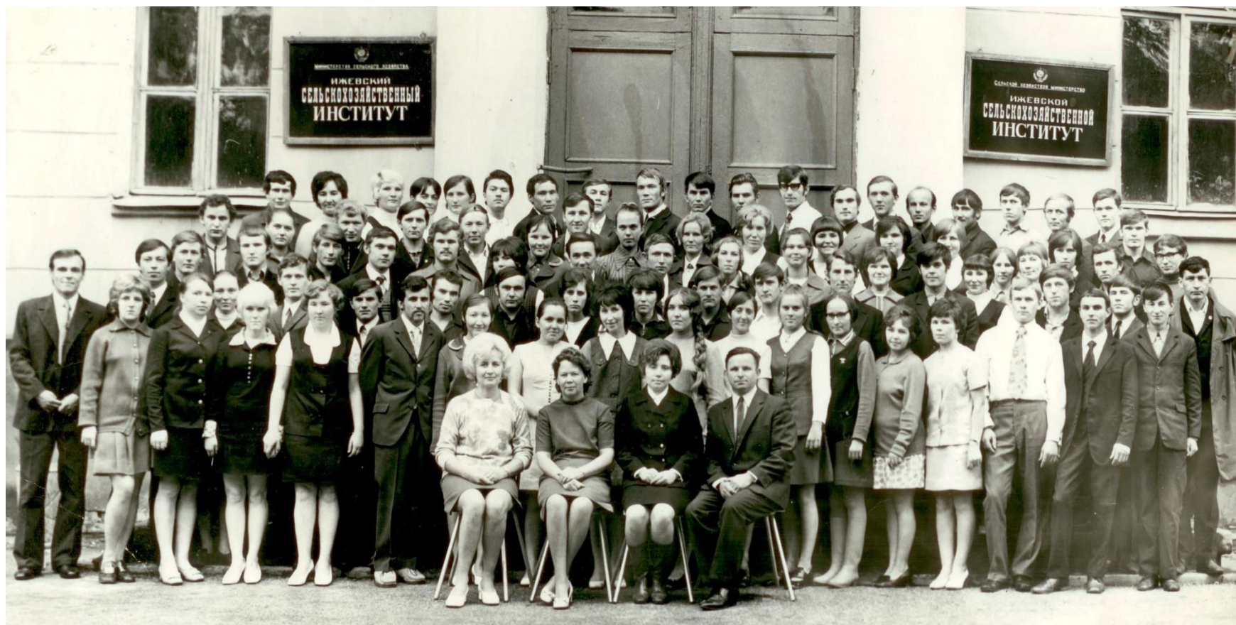
Выпуск слушателей подготовительного отделения 1973 год.

В дальнейшем студенты-выпускники подготовительного отделения, в большинстве своем прошедшие армейскую закалку и имеющие хорошую жизненную школу, формировали костяк студенческих коллективов, составляли значительную часть комсомольского актива, студенческих строительных отрядов, профсоюзных и других студенческих общественных организаций. Факультеты всегда положительно оценивали влияние выпускников подготовительного отделения на формирование студенческих коллективов в учебных группах, потоках и курсах.