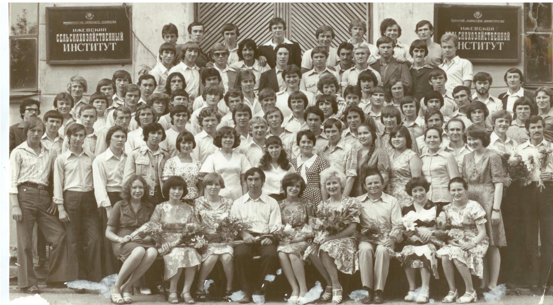
Выпуск слушателей подготовительного отделения 1979 год.

Окончив институт, многие остались работать в родном вузе, защитили кандидатские и докторские диссертации, стали специалистами высокого класса. По сей день они с уважением и теплотой вспоминают своих преподавателей.